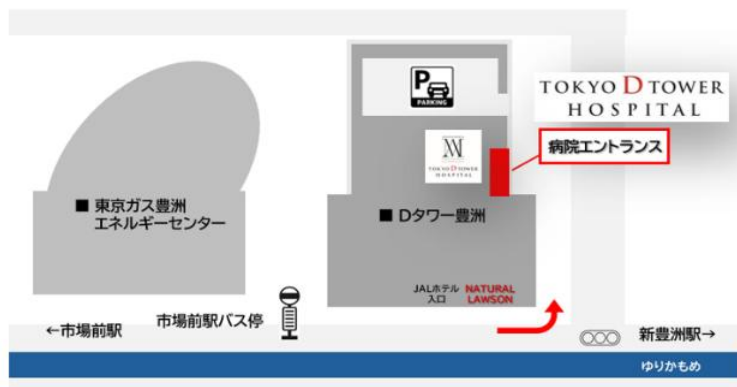
ゆりかもめ市場前駅から徒歩景観